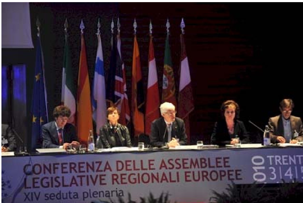
ASSEMBLEA DELLA CALRE – TRENTO, 3, 4 E 5 OTTOBRE