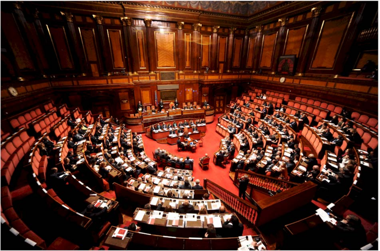
40° ANNIVERSARIO DELLE REGIONI – ROMA, 7 GIUGNO