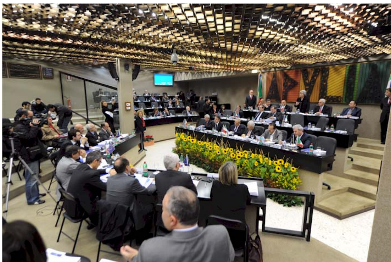
PRESENTAZIONE DEL RAPPORTO SULLA LEGISLAZIONE – BARI, 29 NOVEMBRE