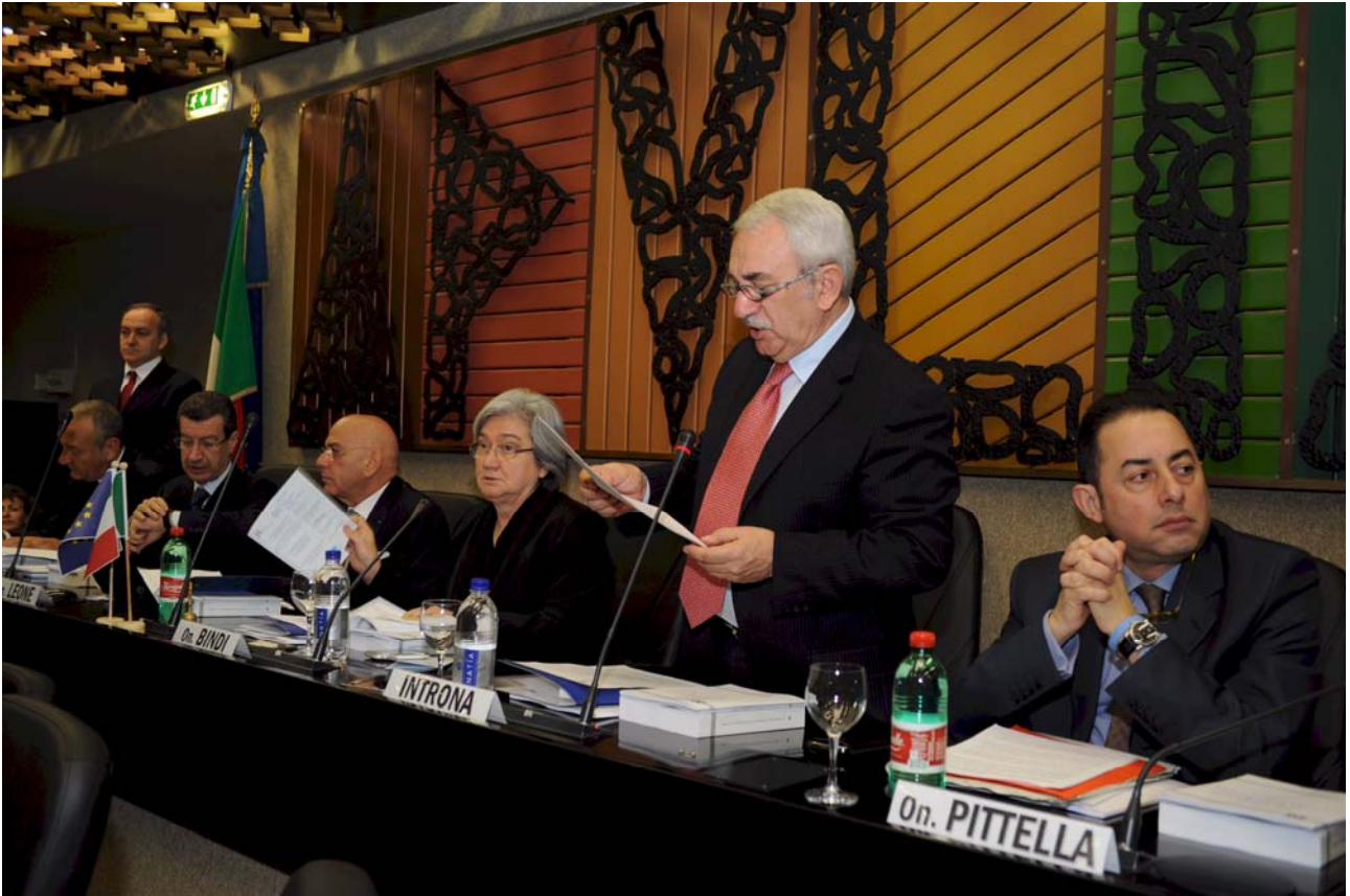
PRESENTAZIONE DEL RAPPORTO SULLA LEGISLAZIONE – BARI, 29 NOVEMBRE