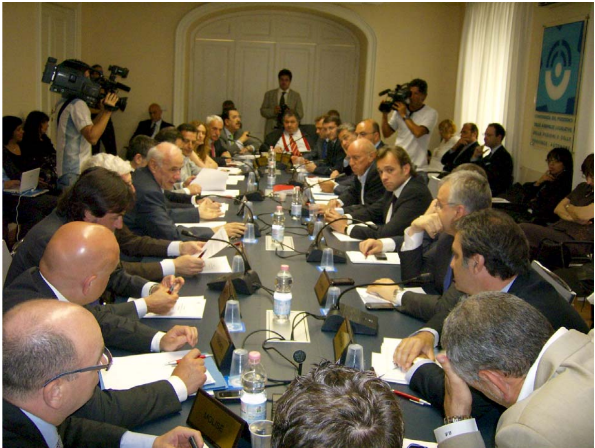
ASSEMBLEA PLENARIA DELLA CONFERENZA – ROMA, 5 LUGLIO